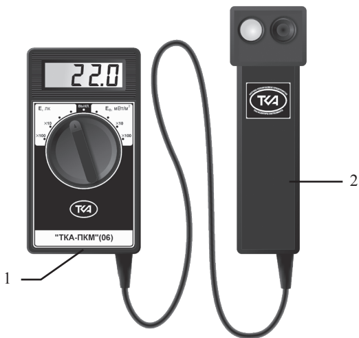
Рис.1. Внешний вид прибора “TKA-ПКМ”(06)